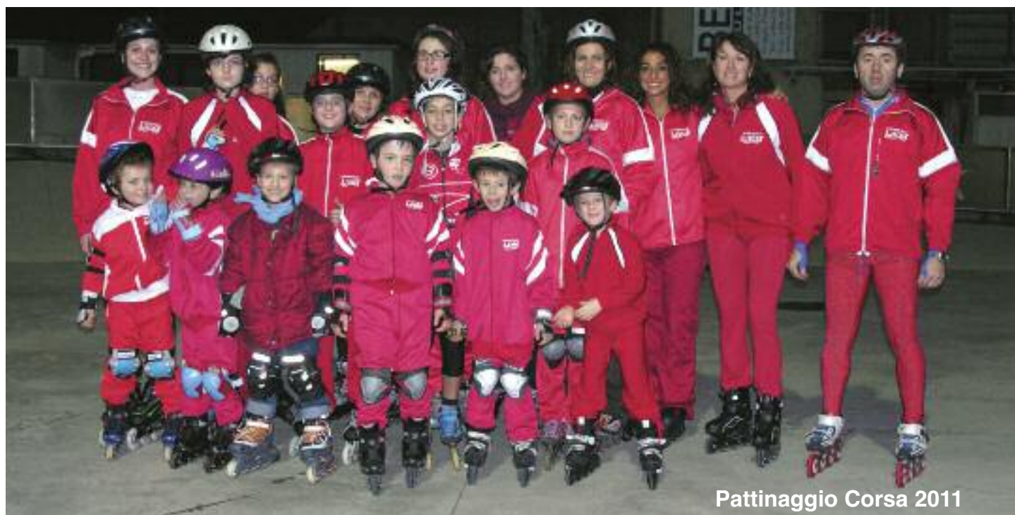
Pattinaggio Corsa 2011

azeta print service s.r.l. Bologna tel. 051 582022 051 5877427 fax 051 582223 www.tipocolor.com