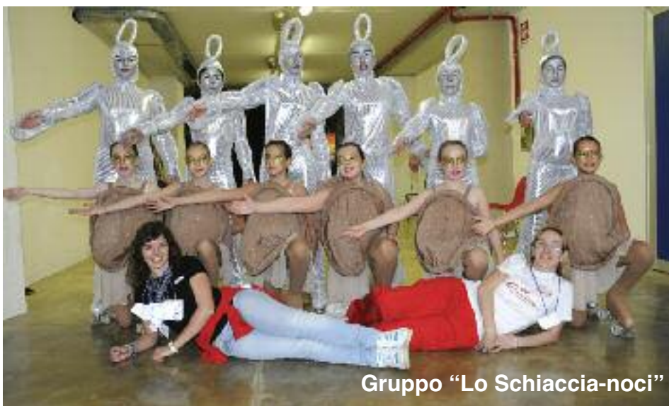
Gruppo “Lo Schiaccia-noci”

Con il medesimo entusiasmo abbiamo poi inaugurato la nuova stagione 2011: abbiamo conosciuto nuovi atleti nel corso del “Prova lo Sport” di settembre e, dopo a uno spettacolo a Mezzolara di Budrio per il nostro Gruppo Adulti amatoriale e il consueto Galà di inizio anno, ci siamo rituffati da gennaio nell'attività. Il 2011 è stato inaugurato dai più piccoli che hanno partecipato al consueto Trofeo Mariele Ventre con il nuovo gruppo “Bolle di Sapone”, che ci ha visti protagonisti nel racconto di un “gioco economico e forse un po' antico”, ma sempre